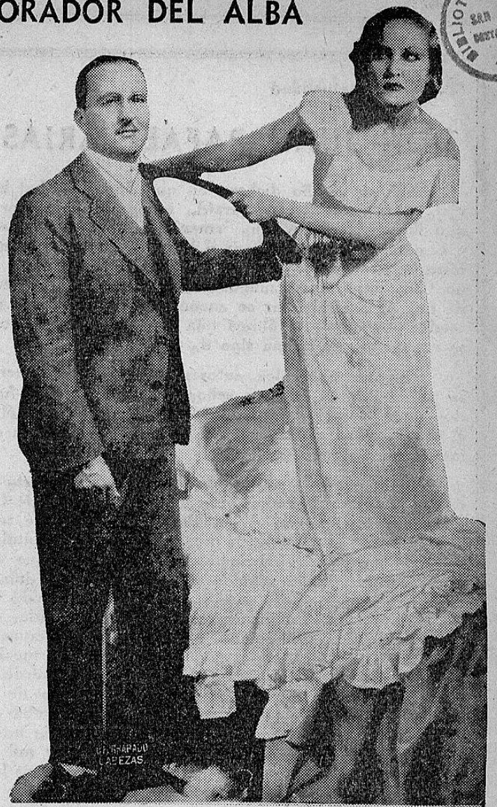
VEASE PAGINA 4